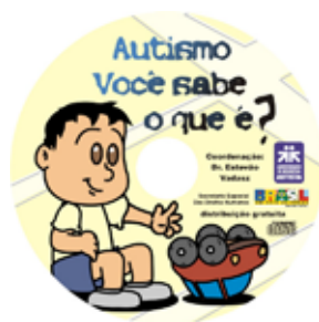
CD - Autismo, você sabe o que é?