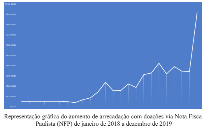
Tabela com os valores mensais arredados de janeiro de 2018 a dezembro de 2019 via Nota Fiscal Paulista